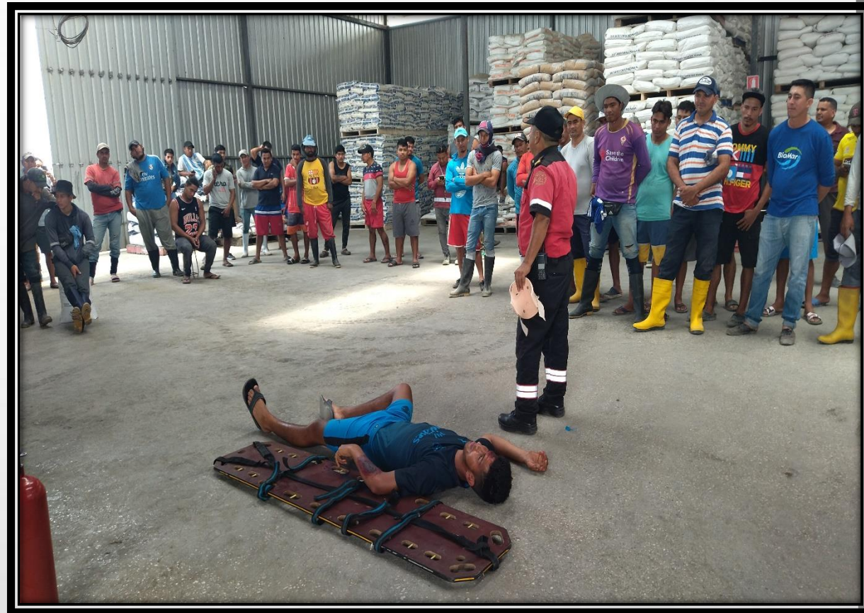
CAPACITACIÓN CAMARONERA VALENTINA 2