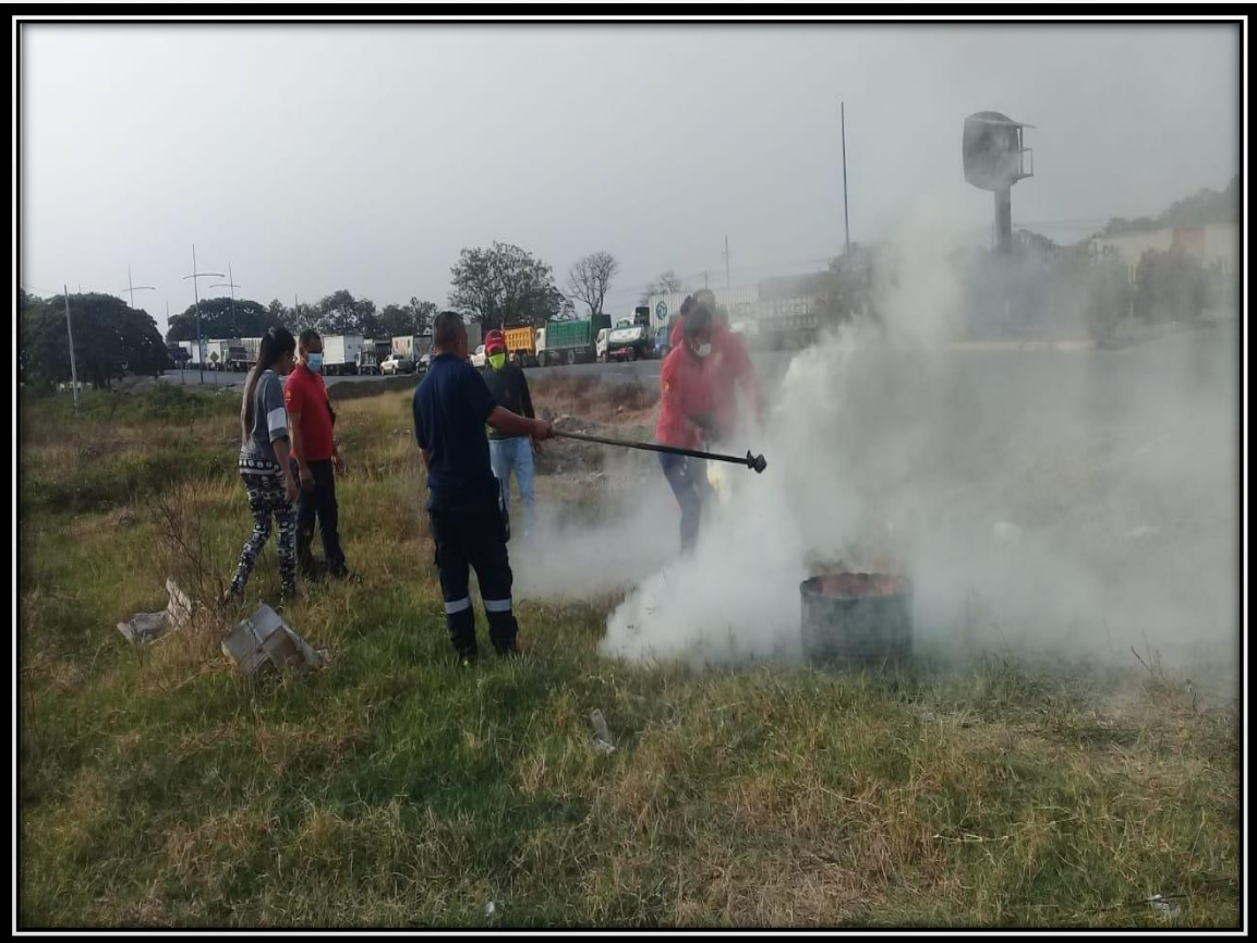
CAPACITACIÓN GASOLINERA "PISONI"